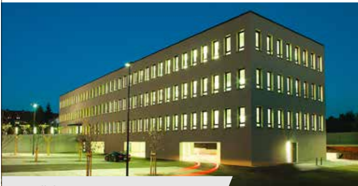
// Servicecenter Telekom, Fulda